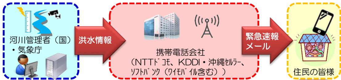
洪水情報のプッシュ型配信イメージ

平成30年5月から、国が管理する天塩川、名寄川で、川が氾濫する可能性が高まった時に、その周辺にいる人に氾濫の危険をお知らせする情報が自動で発信されるようになりました。