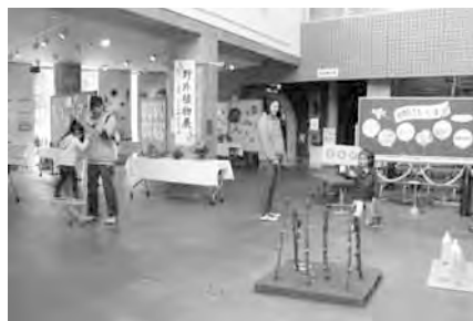
昨年の「博物館であ・そ・ぼ・う!!!」