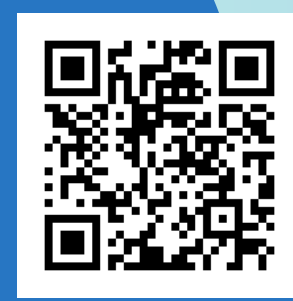
中学生用紹介動画