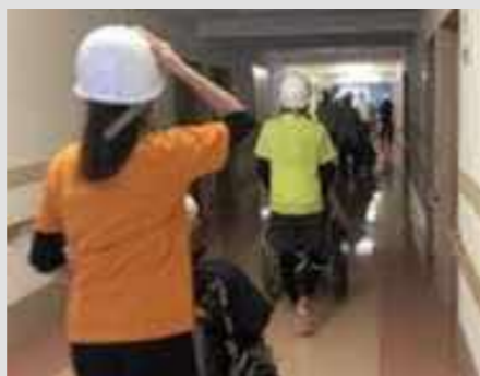
■屋内安全確保訓練