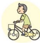
速歩・自転車に乗る 4メッツ