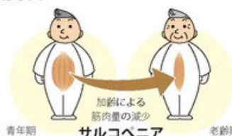
加齢による 筋肉量の減少 サルコペニア

筋肉の量が減少していく老化現象のことです。25 ~ 30歳頃から進行が始まり生涯を通して進行し、老人の活動能力の低下の大きな原因となっています。歳を重ねる毎に意識的に運動強度が大きい運動を行うことが大切です。