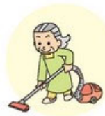
歩く・掃除機をかける 3メッツ

メッツとは運動や身体活動の強度の単位です。安静時(横になったり座って楽にしている状態)を1とした時と比較して何倍のエネルギーを消費するかで活動の強度を示します。