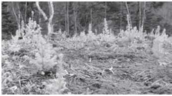
▲助成を受けて植林したカラマツ

この助成活動は、「ニトリを支えてくれた北海道への恩返し」を主眼に、公益財団法人似鳥文化財団と株式会社ニトリ北海道応援基金事務局が植樹活動に対して実施しているものです。