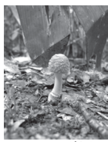
ヒメベニテングタケ▲

◆とき 9月2日(土)～10月1日(日) ◆ところ 北国博物館 ギャラリーホール(1階) ◆内容 楽しいキノコ採り、育てるキノコ、キノコでアート、調べるキノコなど