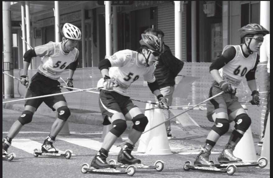
※昨年の競技会のようなす