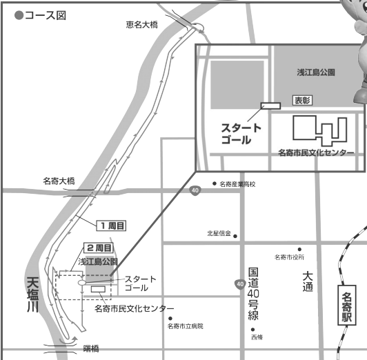
天塩川河川敷特設コース