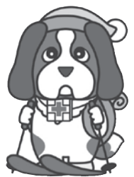
スキーパトロール隊員募集!