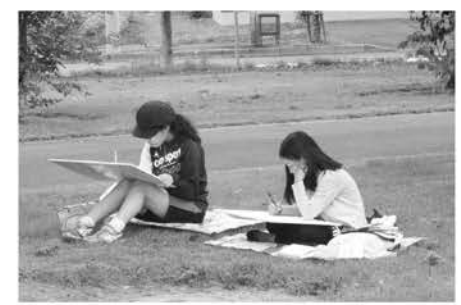
▲昨年の写生会のような様子