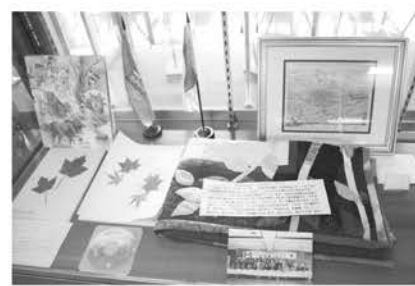
▲国際親善メモリアルホールに展示されている記念品

国際親善 メモリアルホール移動展 市立名寄図書館内の国際親善メモリアルホールに展示されている記念品が移動展示されます。カナダのカワサレイクス市リンゼイ、ロシアのドーリンスク市と名寄市とが、長く姉妹都市交流を重ねてきたことを示す品々とともにその歩みを紹介します。 とき 10月2日(金)〜15日(木) ところ 北国博物館ラウンジ 主催 名寄市経済部交流推進課