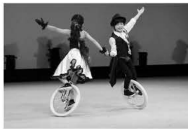
▲昨年の芸能発表のようす

開催期間 11月1日(日)〜3日(火) 展示・芸能プログラムについて 10月下旬に名寄市ホームページなどでお知らせする予定です。