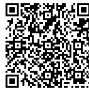
▲二次元コードからも特設ページにアクセスできます

新型コロナウイルスワクチンは 無料 (全額公費負担) で接種できます。「接種には予約金が必要」「事前に料金を振り込むように」といった不審電話などにご注意ください。