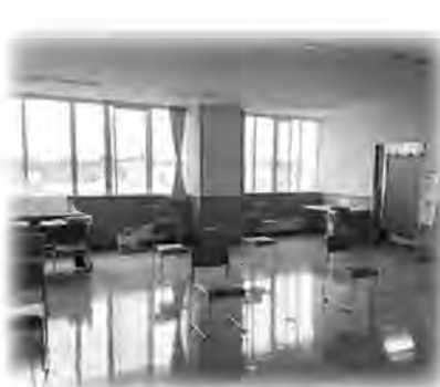
▲感染対策をとりながら健診を実施しています

特定健診を受けている人の生活習慣病治療費(R円)は、受けていない人と比べて年間で36215円も安くなっています！