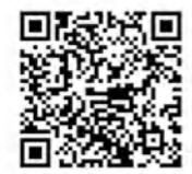
▲こちらのコードから友だち登録できます

親子でお出かけバスツアー 運動会 親子で楽しく運動会! とき 6月25日(土) 9時30分～11時 ※雨天中止 ◆ところ 旧風連日進小学校(風連町日進3141) ◆申込方法 市内子育て支援センターへ直接または電話で申し込みください。 ◆申込期限 6月16日(木)まで