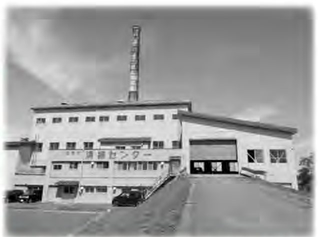
解体工事を行う旧名寄市清掃センター