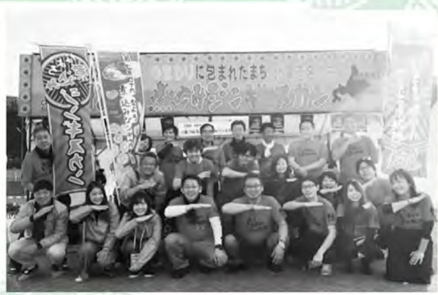
令和元年に兵庫県明石市で開催された「B-1グランプリ」での集合写真