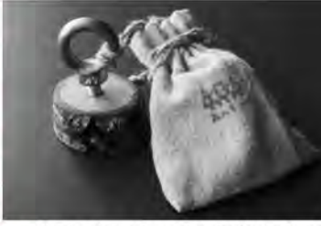
鳥の鳴き声に似た音を出すバードコールを作ります

とき 6月19日(日) 10時~13時 内容 図書館でバードコールを作ってから博物館周辺で野鳥観察を行います。 対象 小学校高学年以上 定員 10人 申込方法 電話または窓口で申し込みください