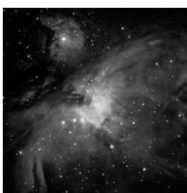
2018年2月6日撮影

オリオン座の三つ星の下にある小三つ星付近に位置し、肉眼でも見える明るい散光星雲です。M42という名前でも知られています。中心部分にはトラペジウムと呼ばれる明るい4つの星があり、オリオン大星雲を輝かせています。M42の左に見える星雲がM43で、2つの星雲がそろって鳥が羽を広げたような形に見えるのが印象的です。