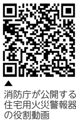
消防庁が公開する住宅用火災警報器の役割動画