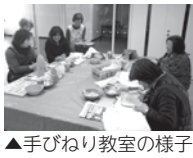
▲手びねり教室の様子