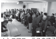
▲シニアコーラスの様子