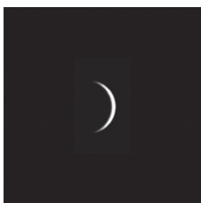
2020年5月22日撮影

7月7日(金)に金星が最大光度を迎えます。このころの金星は、昼間の澄んだ青空の中で肉眼でも見つけることができます。望遠鏡で観察すると三日月のように細く欠けた姿をしています。昼間の金星を観察する際には、太陽を見ないように十分注意してください。