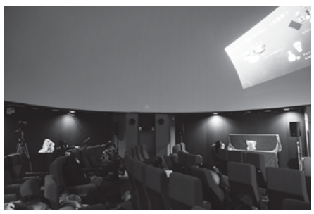
▲前回のプラ寝たリウムの様子

◇羊毛フェルト工作コーナー 23日13時から17時に羊毛フェルト工作を開催予定です。詳しくは天文台Webページをご覧ください。