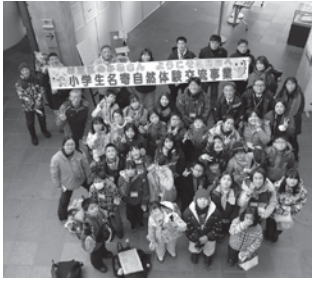
▲昨年の交流会の様子