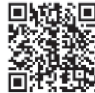
◀名寄市ホームページに掲載しています