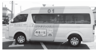
▲中央の黄色いラインと「のるーと」のロゴが目印です

運賃は現金または名寄市電子地域通貨 Yoroocaをご利用いただけます。乗車する際にお支払いください。