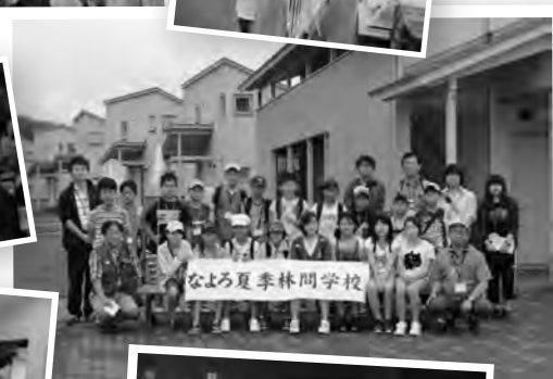
なよろ夏季林間学校