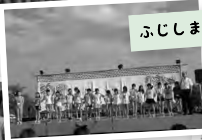
ふじしま夏まつり