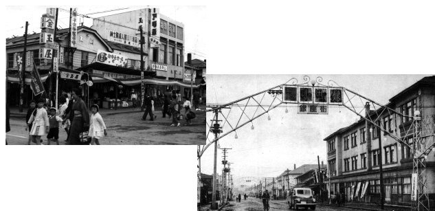
【南5丁目、南6丁目商店街の一角】