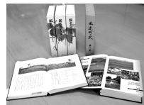
「新名寄市史」と「風連町史第二巻」▲

※販売場所は名寄市北国博物館と、風連町史第二巻については名寄市役所風連庁舎でも取り扱っています。送付希望の場合は北国博物館にご連絡ください。