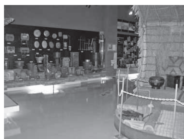
▲常設展示室内でアイヌの住居「チセ」から暖房具コーナーを見ます。

また10人以上1人100円となる団体料金、障害のある方などへの無料制度があります。