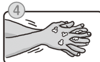
4 指の間を洗います