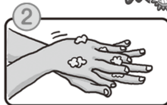
2 手のひらと甲を洗います