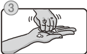
3 爪・指先を洗います