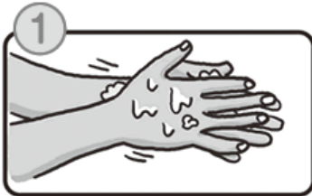
1 水で手を濡らし、石けんをよく泡立てます