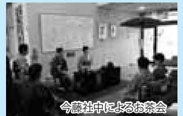
今藤社中によるお茶会

文化センター、ふうれん 地域交流センターでそれぞ れ11月3日まで市民文化 祭の展示などが行われまし た。文芸、美術工芸などの 展示のほかお茶コーナーも