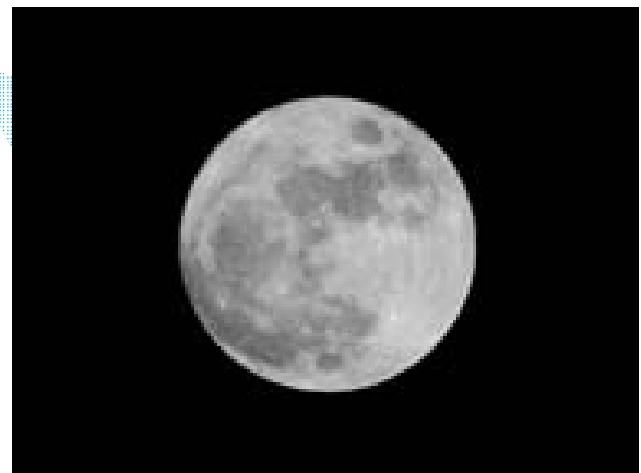
2010年4月28日撮影 なよろ市立天文台にて

満月の日でも、ちょうど満月になる時間があります。その瞬間を「望」といいます。そんな時間ぴったりに撮った写真です。