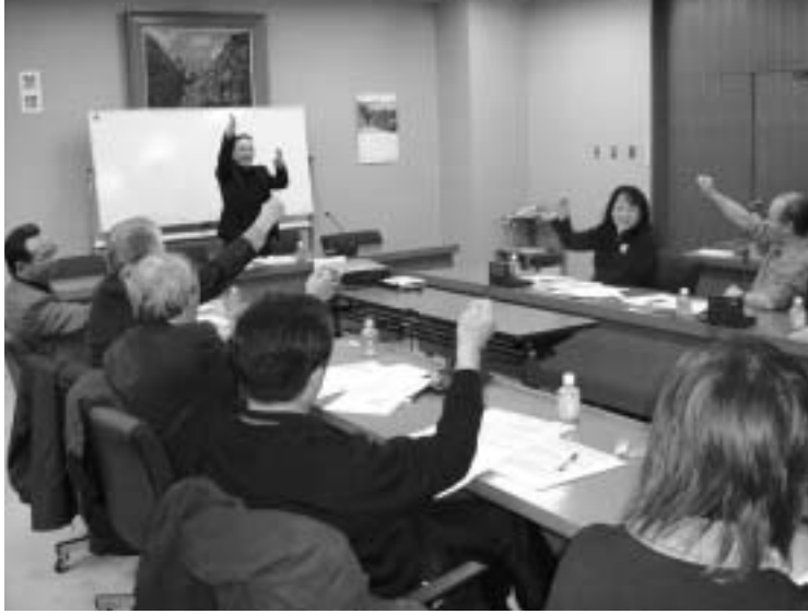
認知症サポーター養成講座の様子

名寄市でも、年々高齢化が進み安心して生活していくためには、避けては通れない課題のひとつとなっています。今月号では、認知症の予防について。来月号では、認知症と正しく向き合うための対応方法についてお知らせし、皆さんと一緒に考えていきたいと思えます。