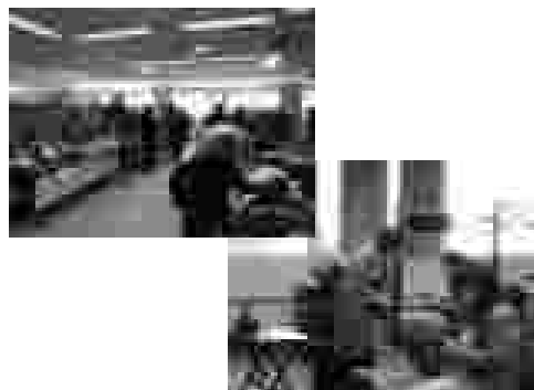
女性ブラザ祭2008の様子(左バザー、右お茶会)

13時道立女性ブラザ（かでる2・7）到着。 東京大学大学院教授小森陽一氏の教養講演会「人類史から考える女性の人權 物語の中の女性たち」には、名寄からの参加者の他にも大勢の人が参加しており会場を埋め尽くしていました。 講演は、源氏物語をもとに、女性は国盗りの手段として、男子を産む機械としてすでに女性差別が始まっていた。そんな中、漢字を崩して「かな」をつくり女文字の文化をつくるなどを、ユーモアのある話で会場から笑いもあり90分の講演会があつという間でした。 13日は日本最大規模で膨大な書籍量を誇るコーチャンフォーを見学しました。 昨日の講演会での「源氏物語」をさっそく探す人もいました。帰りのバスの中では、今回、初めての試みだったバスツアーのアンケートを実施しました。今回のバスツアーに参加した市民みなさんからは良かったと回答がありました。 1月号では、アンケート結果についてお知らせします。