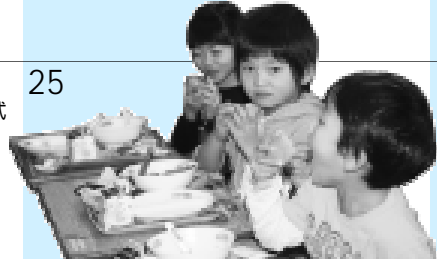
姉妹都市藤島から届いた庄内柿が学校給食に(南小)