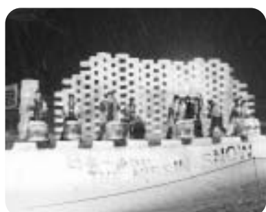
クリスタルウォールの前で、風連御料太鼓が演奏を披露

日進100年記念として行われた第17回目の同フェスティバルは、会場全体がクリスタルウォールや灯ろうなどの暖かい光に包まれ、地域内外から訪れた人々で賑わいを見せました。