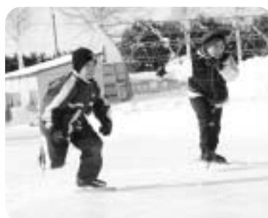
リンクの上を力強く滑る児童