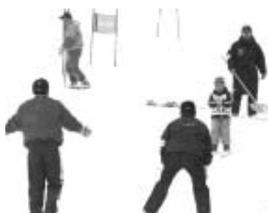
グライド(直滑降)の様子

昨年10月に発足したSON名寄地区会が主管する記念すべき第1回冬季競技会には、全道各地からアスリート、ボランティアなど合わせて300人が参加し、知的発達に障がいのある人たちの自立と社会参加を目指して、日頃のトレーニング成果を発表していました。