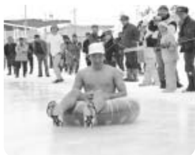
仮装のチームもあり、盛り上がりを見せた「全日本氷上人間カーリング」