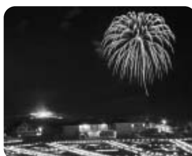
北の天文字焼き、花火大会、東小学校グラウンドのスノーランタン

冬の一大イベントの同フェスティバル。ジャンボすべり台などは、元気に遊ぶ子どもたちの姿が多く、会場は親子や家族連れなどで賑わっていました。