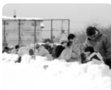
スノーランタン制作の様子 (会場：豊西小学校)

2月3日の大学公園、総合福祉センター、豊西小学校の3会場が始まったスノーランタンの集い。10日に東小学校、17日に西小学校の5会場での冬の夜を彩るスノーランタンのほのかなあかりが灯りました。