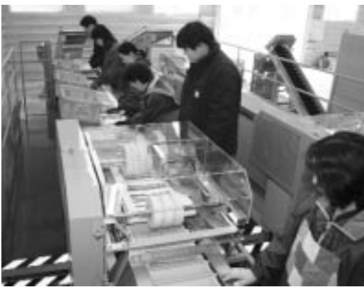
自動選別の根切りの行程

導入されたアスパラ自動選別機は、全ての選別行程を行うことのできる全国でも名寄だけの設備で、選別から根切り、結束までを全自動で行います。形や大きさ、傷や曲がりなどの有無などの選別を行い、約23cmに切りそろえる根切りのほか、自動で束ねることが可能です。