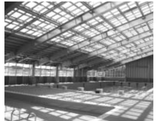
屋内は太陽光で明るく開放的

市内4カ所のプール施設について、利用案内をお知らせします。また、昭和42年に開設された西水泳プールは廃止となりました。