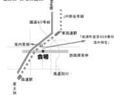
植樹会 会場位置図