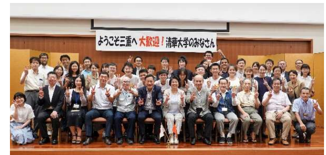
(2019年 津市で開催された 清華大学生の歓迎会)