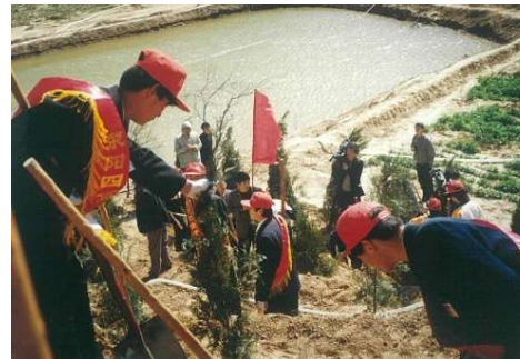
(2000年 河南省鄭州での植林作業)