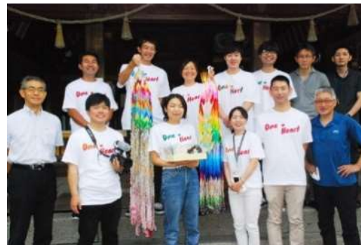
(寄贈した手作りマスクと千羽鶴)