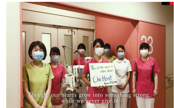
(応援メッセージソング動画の1コマ)