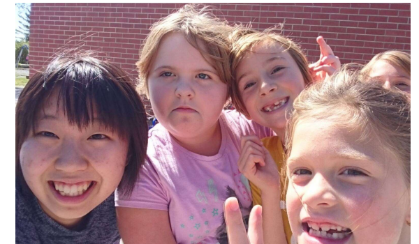
(約半世紀にわたり行われている交換留学生派遣・受入事業)