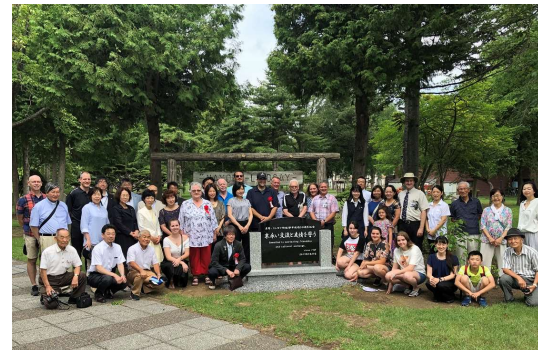
(リンゼイ市民親善訪問団と50周年を祝い記念碑を建立)