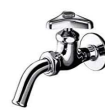
吐水口回転単水栓