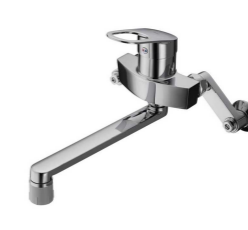
レバー式混合水栓