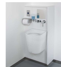
オストメイト汚物流し