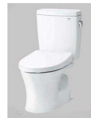
大便器 (ロータンク式)