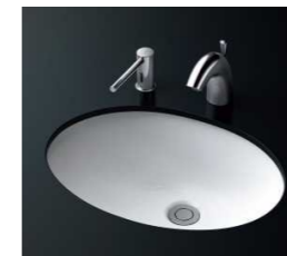
洗面器 (自動水栓、アンダーカウンター式)