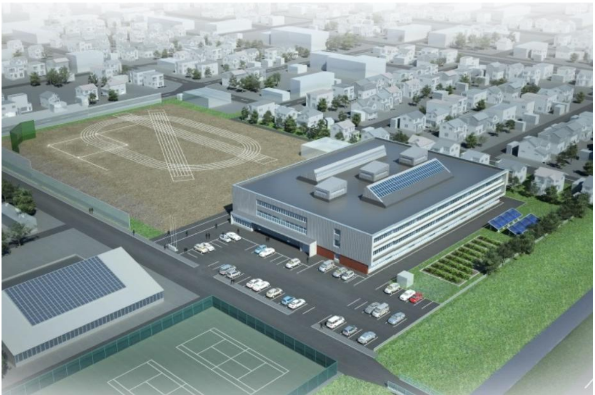
名寄南小学校 完成予想図